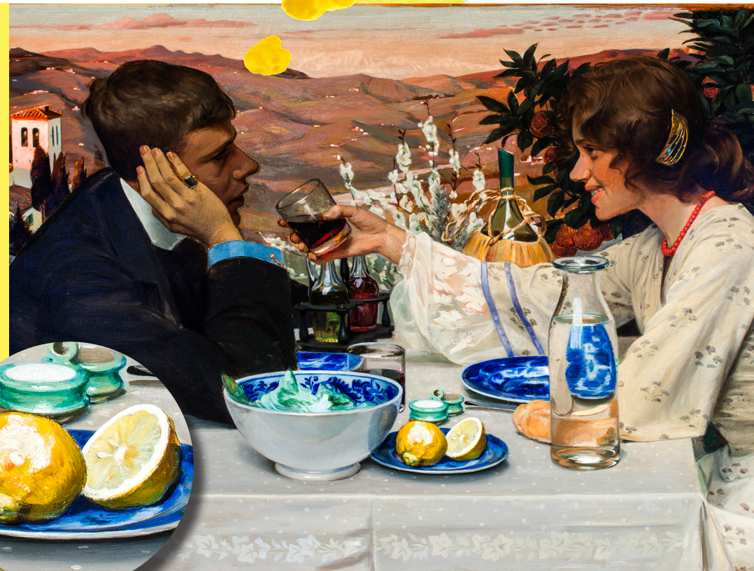
Primavera(forår), Harald Slott-Møller, Olie på lærred, 1901 • Læs mere på Kunsten.dk/kreativarium