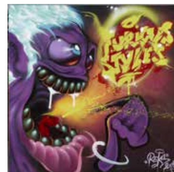
Reks, 2013 ejes af kunstneren