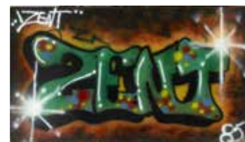
Zent, Reakes, 1985 Grffitigalleriet.dk