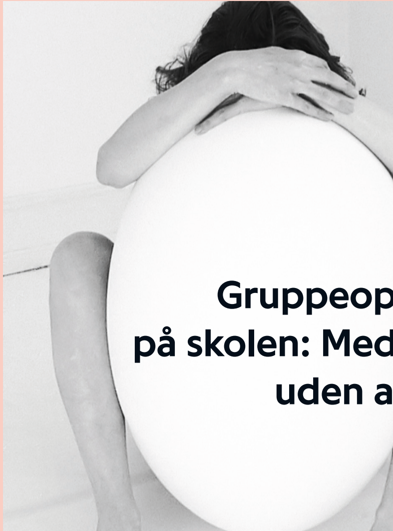
Tableau. Eggs, 1999