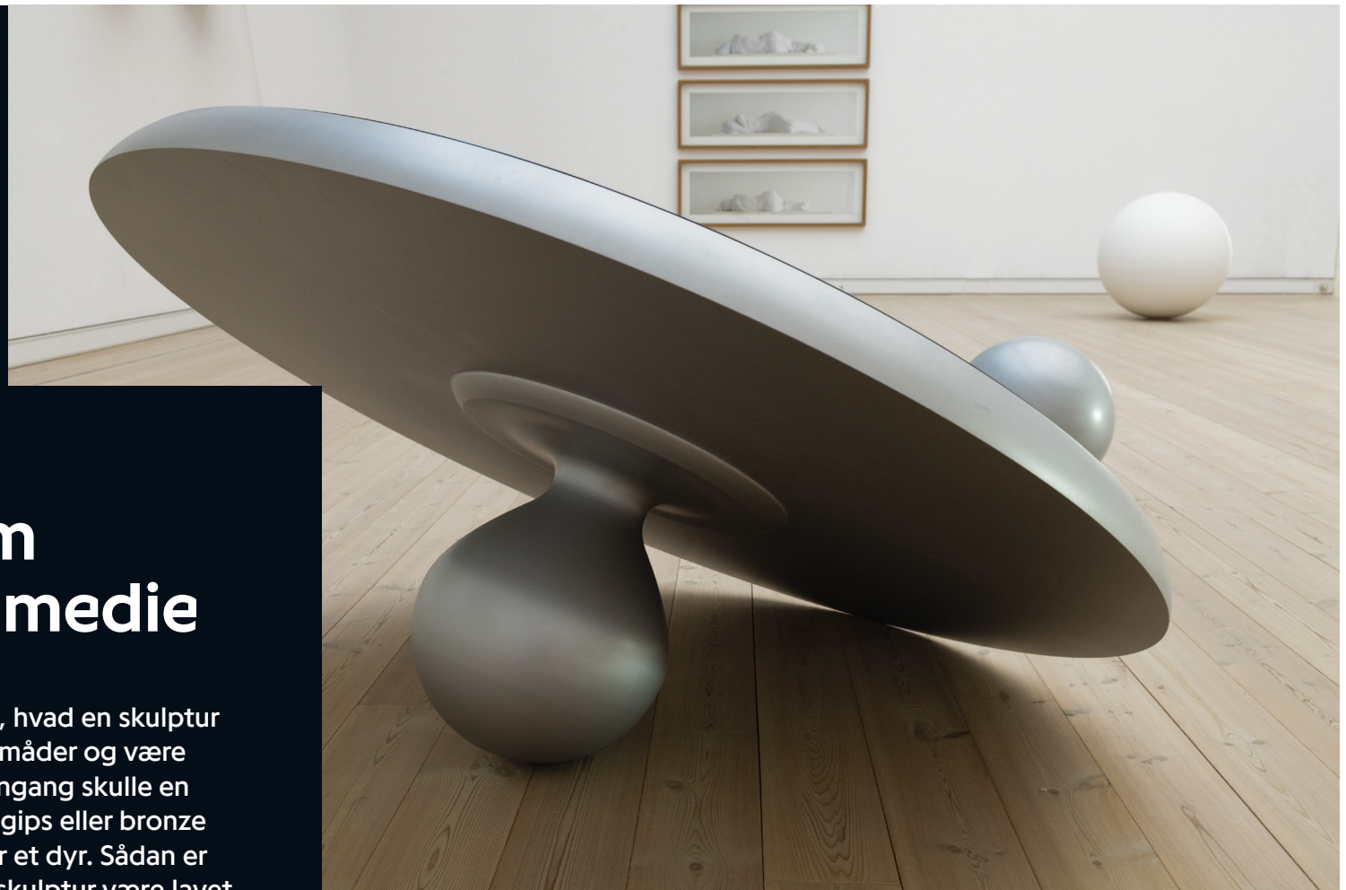
Pandora's Lid, 2010

Fælles for alle skulpturer er dog, at det er rumlige kunstværker – det vil sige, at kunstværket er i tre dimensioner (hvor f.eks. et fladt maleri er i to dimensioner).