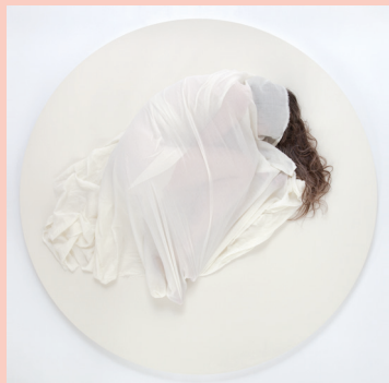
Solen er hvid / Off White, 2014