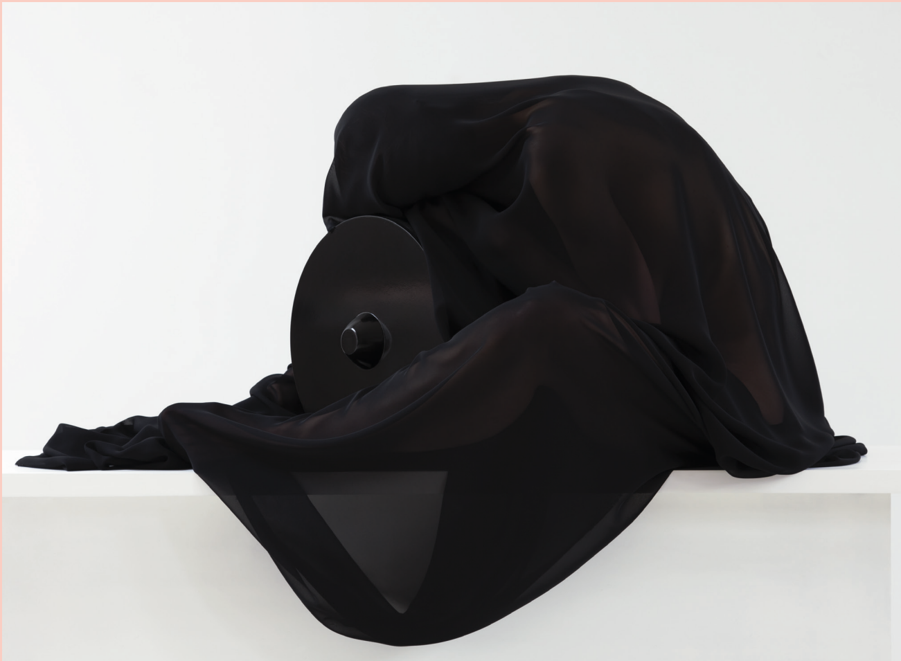
Black Matter, 2012