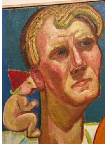
Udsnit af værket Nissens Hemmelighed

Kig på værket: Nissens hemmelighed . Hvad hvisker nissen i Heerups øre? Skriv på linjerne, hvad nissen hvisker.