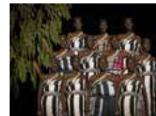
Værk: Women's War, Nigeria, 1929 (2016)

I lyset af denne hændelse opstod Black Lives Matter bevægelsen i 2013, hvor hashtagget #BlackLivesMatter florerede på sociale medier som protest mod frifindelsen af George Zimmerman for mordet på Trayvon Martin.